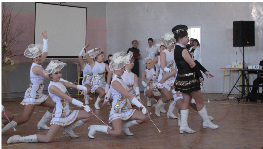
Fot.: Mażoretki Ladies podczas Dnia Otwartego