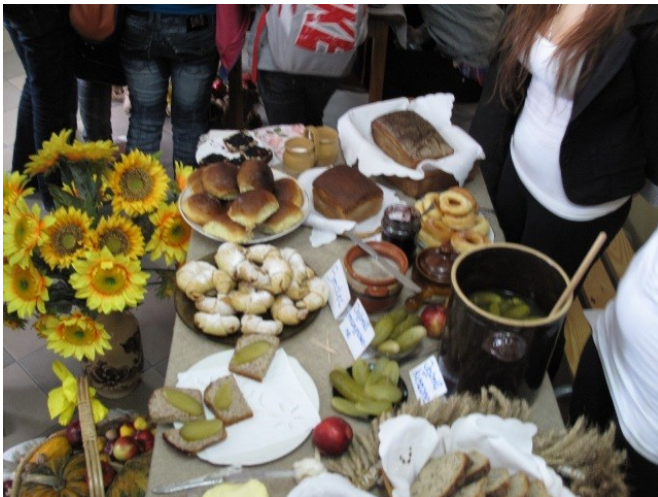
Fot. Stoisko zwycięskiej drużyny z klasy IV BJT

Sery domowej roboty, smalec ze skwareczkami, ogórki konserwowe, wędliny, masło, konfitury i słodkie smakołyki królowały obok tradycyjnie wypiekanych chleba.