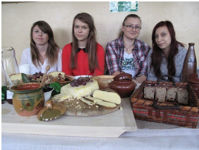
Fot. Stoisko klasy I RT - II miejsce w konkursie.

III – klasy II JT. Wyróżnienia otrzymały klasy: IV aJT i III JT. W konkursie oceniano smak i wygląd pieczywa, sposób jego promocji, dodatki regionalne oraz estetykę stoiska.