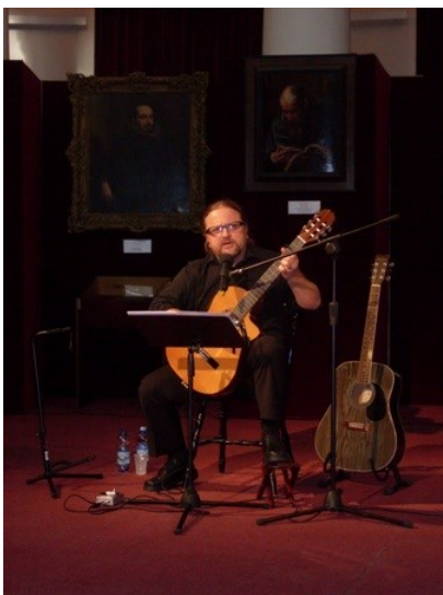
Fot. G. Kucharzewski podczas koncertu w Galerii Porczyńskich w Warszawie.

Raz w roku Stowarzyszenie organizuje zjazdy łagierników. Oprócz członków mieszkających w kraju, na spotkania przyjeżdżają ich koledzy z dzisiejszej Litwy, Białorusi i Ukrainy - Polacy, którzy pozostali na ziemiach dawnej Rzeczypospolitej i nie było im dane połączyć się z rodakami. Z roku na rok jest ich coraz mniej. Wielu z nich odchodzi na wieczną wartę. Każdą chwilę spędzoną w czasie zjazdu wykorzystują skwapliwie, choć wiek raczej powinien nakazywać odpoczynek. Wiedzą, że w następnym roku będzie ich mniej. Każdy zjazd dla wszystkich uczestników jest doniosłą uroczystością. Główny cel spotkania to konsolidacja środowiska, uhonorowanie osób zasłużonych, omówienie dotychczasowych działań i planów na przyszłość .