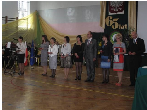
Fot. Odznaczeni Medalem KEN