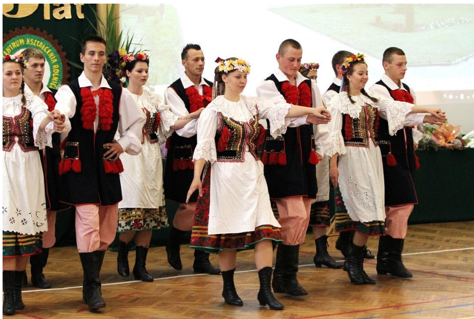
Fot. Ludowy Zespół Pieśni i Tańca „Sejny” podczas 65-lecia Szkoły.