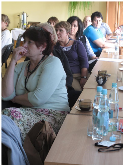
Fot. Uczestnicy seminarium

W dniach 12-16 czerwca internat gościł organizatorów i nauczycieli ogrodnictwa z całej Polski, którzy uczestniczyli w seminarium na temat Produkcja ogrodnicza na terenach o trudnych warunkach glebowo-klimatycznych , zorganizowanym przez Krajowe Centrum Edukacji Rolniczej w Brwinowie.