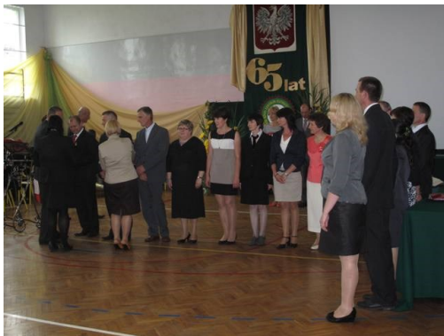
Fot. U honorowani odznaką „Zasłużony dla rolnictwa”