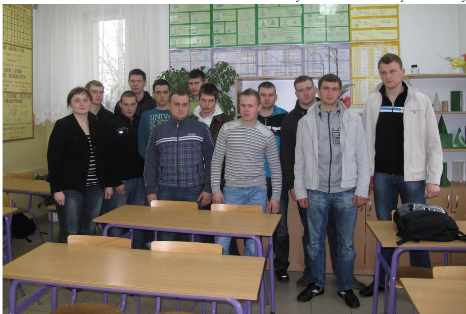
Fot. Klasa IV cBT z wychowawczynią