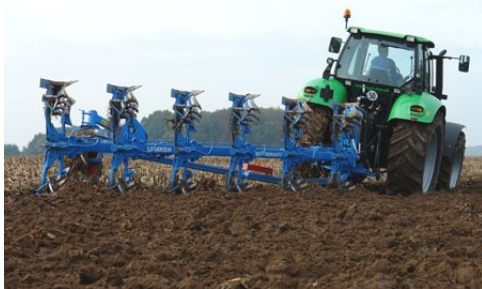
Fot. Plug hybrydowy firmy Lemken