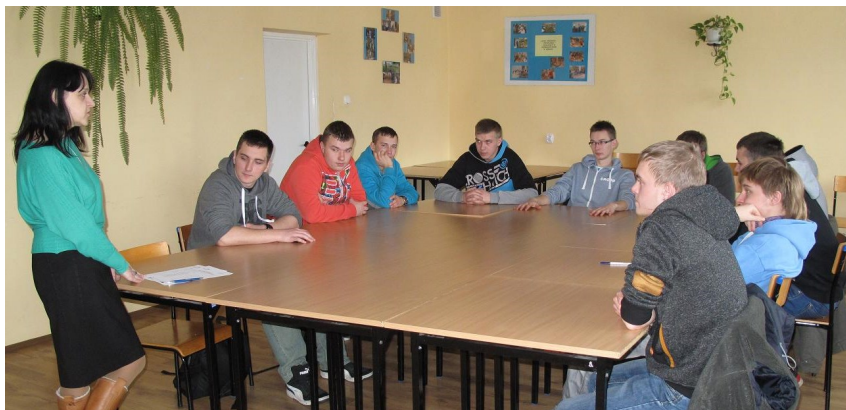
Fot.: Szkolenie z zakresu wymagań formalnych i merytorycznych na ponadlokalnych i międzynarodowych rynkach pracy w branży mechanicznej