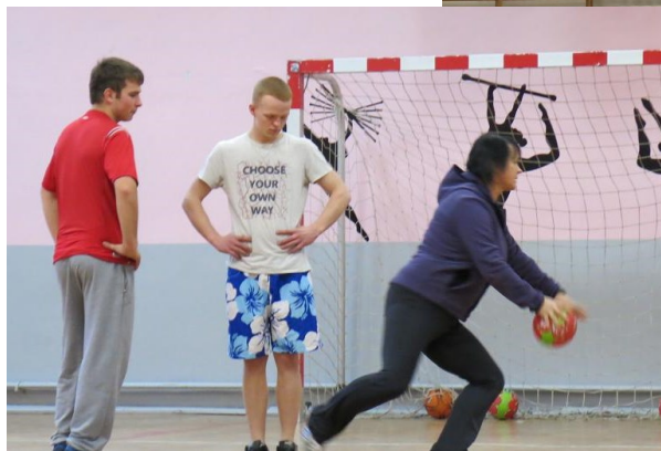
Fot. Drużyna piłki ręcznej chłopców podczas treningu