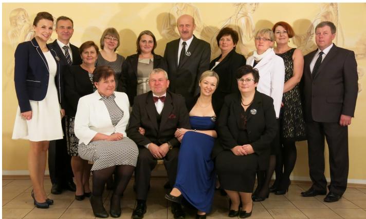
Fot.: Dyrektor, wychowawcy i rodzice trzecioklasistów